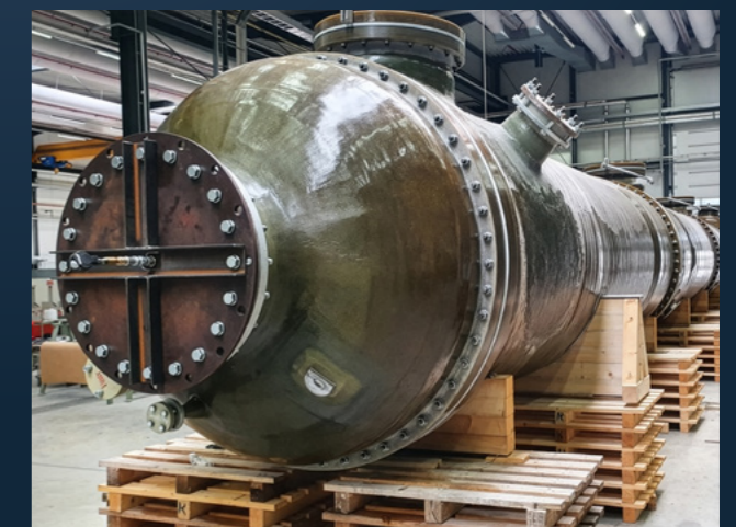
HCl Absorptionskolonne aus KERAVERIN® PTFE-M / GFK. Maße DN 1700/2300 x 31460 mm.