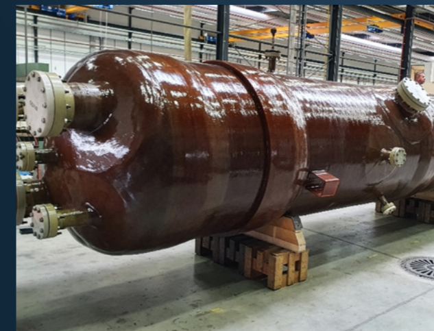
HCl Desorptionskolonne aus KERAVERIN® PTFE-M / GFK. Maße DN 1500 x 12997 mm.