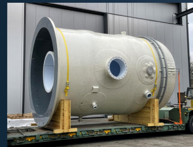
Separator aus KERAVERIN® PTFE-M / GFK. Maße DN 3100 x 5639 mm.

Steuler arbeitet eng mit renommierten Herstellern von Kunststoff-Einbauten zusammen. Bereits in der Engineering-Phase werden diese Bauteile in der Designplanung berücksichtigt – so unterstützen wir bei maximaler Passgenauigkeit und Funktionalität. In der Regel erfolgt eine Probemontage direkt bei uns im Werk, um eine reibungslose spätere Installation sicherzustellen. Zusätzlich begleiten unsere Technical Advisors die Endmontage vor Ort, sodass ein einwandfreier Einbau mit dem Fokus auf höchster Betriebssicherheit gewährleistet werden kann.